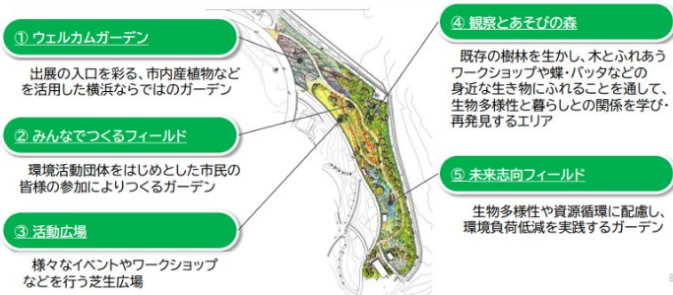
フィールドを活用した活動拠点のコンセプト及び構成