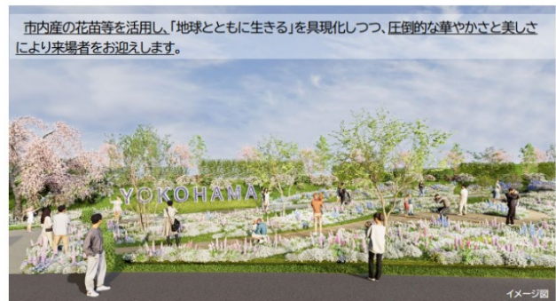
ウェルカムガーデンのイメージ（一部）